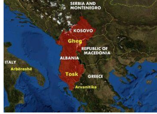
Ana hatlarıyla Gheg e Tosk bölgeleri

Ey kardeşlerim! Bu gün olayların bizi Türk kardeşlerimizden ayrılmaya ve yüz yıllardır üzerimizde dalgalanan bayrağı indirmeye ve yerine kendi hükümet ve Arnavut bayrağını koymaya zorladığını söylemek zorunda olmak çok derin bir ızdırıp ve acı vermektedir. Allah bizi bu gün olduğu gibi tekrar bir araya gelmeye ve anayurdumuzu düşman işgaline karşı savumaya muktedir kılsın! Bağımsız Arnavutluk çok yaşa! Kardeşlik çok yaşa! Milli bayrağımız çok yaşa! 12