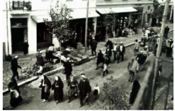
20.yüzyılın başında Müslüman Arnavutlar

Bununla birlikte, Arnavutluk'un Büyük Güçler tarafından 1914 yılında tanınması ve Wied'in Prince William Friedrich Heinrich'in devlet başkanı olarak atanması merkezi Arnavutluk'ta büyük bir başkaldırıya neden oldu. Müslümanlar kendilerini bir kez daha Osmanlı ilan ettiler ve Büyük Güçler'den kendilerini Türkiye'yle birleştirmelerini talep ettiler. 19 Güneydeki Himara Hıristiyanları Müslümanların hakim olduğu bir Arnavutluk'ta yaşamayı reddettiler ve Büyük Güçler'e Yunanistan'a katılma teklifi götürdüler. 20 Zira Arnavut olma düşüncesini onlar da anlayamamıştı. Yedi yıl sonra, Mirdita'nın Katolikleri Tiranda Türkiye hükümeti istemiyoruz! diyerek aynı deklarasyonu yaptılar. 21 Bu örneklerin hepsi "Türkler" ve "Gavurlar" kimliğinin Arnavutluk'a dönüştürme işleminin ne kadar uzun ve zorlu olduğunu göstermektedir.