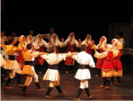
Kadın ve erkeklerin bir arada yer aldığı oyunlar folklor gösterilerinde de mevcuttur.

tamamen reddetmemiştir. Hatta günümüzde bile İslâm'la bağdaşmayacak geleneklerin bazı bölgelerde halâ devam ettirildiğini görmekteyiz. Buna örnek olarak düğünlerde kadın-erkek birlikte oynanan geleneksel oyunları gösterebiliriz. Bizim burada yapmaya çalıştığımız; Üsküp'te yaşayan Müslüman toplulukların örf ve adetlerini tek tek ele alıp bunlar hakkında bilgi sunmak değil, özellikle komünist sistemden günümüze kadar olan dönemde örf ve adetlerin Üsküp'teki Müslümanlar için oynadığı rol ve onların algılanışı hakkında, ki gözlemlerimizi belirtmektir.