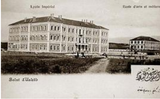
Osmanlı döneminde var olan Üsküp Güzel Sanatlar Akademisi bugün yok.

sıra pozitif ve sosyal bilimlere dair dersler de okutuluyordu. 17