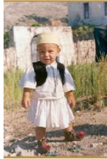
Beyaz takkesiyle bir Arnavut çocuk

bazı gelenekler sembolik anlamlar kazanmıştır. Toplumun yaşantısında önemli bir yer tutan eski ve köklü alışkanlıklar, gelenek, görenekler ve yüksek değerler gerçekte dinle hiçbir ilgileri bulunmasalar bile, zamanla dinî bir nitelik kazanabilirler. Gerçekte bu onların varlıklarını uzun süre koruyabilmeleri için de gerekli olmaktadır. 6 Çoğu Osmanlı döneminden kalan uygulamalar (gençlerin beyaz takke, yaşlıların kırmızı fes, kızların "başlık" yaşlı kadınların tülbent takmaları) yaygınlaştırılmış ve her etnik grubun ortak kültürü olarak görülmüştür. Günümüzde dahi Üsküp'te gerek Arnavutlarda gerekse diğer etnik guruplarda millî örf ve adetler-kendi aralarında ki etkileşimden dolayı-diğer devletlerde yaşayan soydaşlarına nispeten farklılık arz eder.