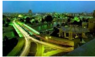
2000'lerde Üsküp'te her şey gibi ilişki biçimleri de değişiyor

Bu durumun daha çok dinin sosyal kurumlar üzerindeki etkisini yitirmeye başlamasından, daha doğrusu iyi bir dinî eğitimin verilememesinden insanların yanlış ve eksik dini bilgilerinden kaynaklandığını belirtmek mümkündür. İlim konusunu ele aldığımızda değineceğimiz sorunlardan da görüleceği gibi, bugün Üsküp Müslüman topluluklarındaki ahlakî gerilemede bilgi eksikliği ve cehaletin büyük rolü olduğunu da söylemek gerekir. Çünkü ilmin, insanın algılayışlarında ve zihin dünyalarının gelişiminde büyük etkisi olduğu bilinen bir gerçektir. Değerlerin algılanışı ve pratik olarak yaşanması üzerindeki etkisinden dolayıdır ki eğitim, yüzyıllardır her ülkenin öncelikli problemi olagelmıştır. Aynı eğitimi almış kişilerin hayata bakışları, kaygıları, duyarlılıkları, değer yargıları ve ahlak anlayışları da birbirine yakın olur. Zaten bir insanın ahlak anlayışı, bir bakıma onun düşünce dünyasının ve hayata bakış tarzının sosyal ilişkilerine ve davranışlarına yansımalarından ibarettir. Ahlak insanın düşünce dünyasında ve pratik hayatında apayrı bir alan oluşturmaz. Onunla iç içe ve onun uzantısıdır. 12