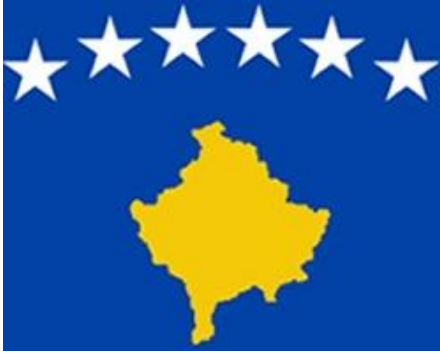
Kosova Cumhuriyeti bayrağındaki 6 yıldız Kosova'daki halkları simgeler

Kosova adı, İllirya kabilesinden gelen Kas-Kos dağ-orman Va/Va-u yüksek-düz anlamına gelen kelimelerin birleşmesinden oluşmuştur. 1913 yıllarından önce Kosova'nın yüzölçümü 29.900 km 2 idi. Bugün ise, 10.887 km 2 dir 57 . Başkenti Priştine olan Kosova'nın nüfusu 2.300.000 milyondur. Nüfusun %90'ı Arnavut, %4'ü Sırp-Karadağlı ve %6'sı Türk ve Boşnaklardan oluşmaktadır. Kosova'da konuşulan Diller arasında Arnavutça, Türkçe, Boşnakça ve Sırpça yer almaktadır. Para birimi Euro'dur.