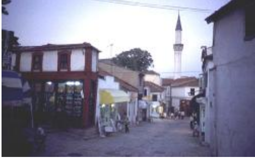
Üsküp çarşısı minarelerin gölgesindedir.

olmak, sözünün eri olmak gibi yüksek değerlerin öğrenildiği, bunlara hassasiyet gösterildiği bir ortam olarak görülmektedir.