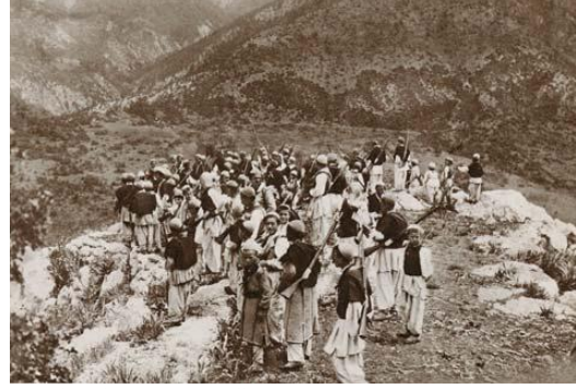
Miredita'nın Katolik Arnavutları Türklere karşı savaşa hazırlanıyor. 1912

Müslümanları sadece kendilerini Arnavut hissetmemekle kalmadılar fakat milliyetçilerin kafır, ahlaksız ve kalles olduklarına inandılar. 7