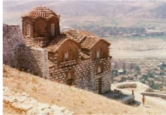
Berat Ortodoks Kilisesi

Diğer yandan da yukarıda belirttiğimiz gibi Kral III. Leon'nun Arnavut topraklarını Doğu kilisesine katmasıyla Arnavutlukta Ortodoks kilisesi, Kirillos ve Methodios tarafından 867-886 tarihlerinde kurulmuştur. 27