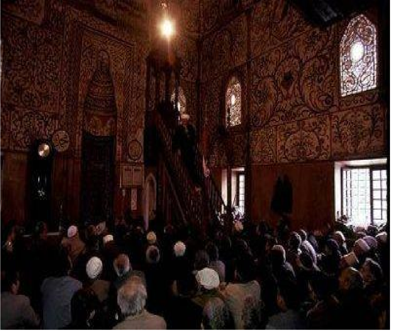
Ethem bey Camii evlatlarını toplarken...