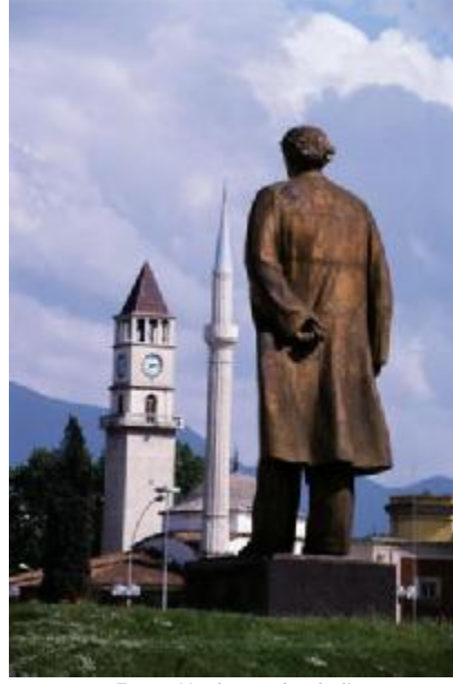
Enver Hoxha'nın heykeli ve mahzun Ethem Bey Camii

şu ki, o gün benim ve dindarlar için 'Son Cuma' imiş. 7 (Devam edecek...)