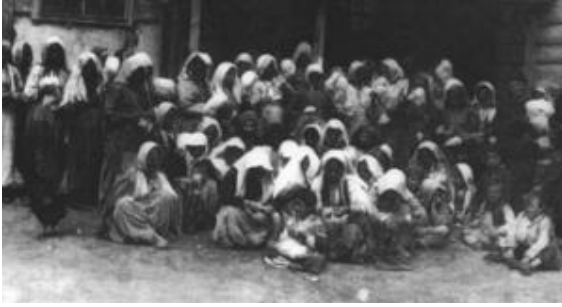
Toplama kamplarında tutulan ve bir kısmı tecavüz edildikten sonra öldürülen Müslüman kadınlar 1945

Yunanistan ayrıca, Çamerya'da yaşamaya devam eden Ortodoks inançlı Arnavut halkın kimliklerini koruma çabalarını da şiddet kullanmak suretiyle bastırmıştır. Anadilleri olan Arnavutça'nın toplum içerisinde konuşulması yasaklanmış, Ortodoks oldukları halde, Çamerya'da kalan Arnavut halka güvenilmediği için 1945'den sonra bölgeye Yunanlılar, Arumeniler (Ulahlar) ve Çingeneler yerleştirilmiş, sınır dışı edilen Çamların mülkleri, yasal mülkiyet hakkına sahip olmadıkları halde yeni yerleşimcilere tahsis edilmiştir. Bu uygulamalara ilaveten 25 bin civarındaki Çamerya Arnavut'u, EDES çetelerince süngü zoru ile Arnavutluk'a göçe zorlanmışlardır. Bu olay, II. Dünya Savaşı sonunda yaşanan bir tehirci trajedisidir. Ve bugün bilindiği kadarıyla, General ZERVAS'ın etnik temizlik kampanyası sonrasında Epir bölgesinden bir Müslüman Arnavut varlığı kalmamıştır.