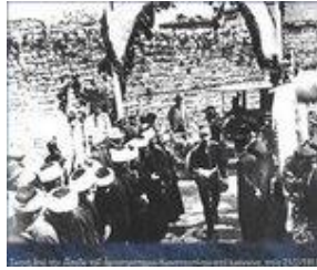
Yunan ordusunun Yanya'ya girişi 1913

Daha sonra da Müslüman Çamları, Lozan Antlaşması'nın bir ön çalışması olarak imzalanan "Türk ve Rum Ahalinin Değişimine İlişkin Sözleşme ve Protokol"ü kapsamına dahil edip Türkiye'ye göndermek isteyince, Çamlar direnmişler ve bu uygulamayı 1913 Anlaşması'na atıfta bulunarak reddetmişlerdir. Milletler Cemiyeti (BM) Karma Komisyonu ise