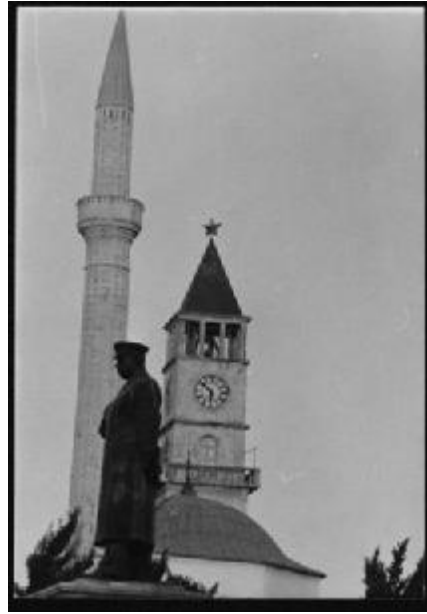
Mahzun Ethem Bey Camii ve Stalin heykeli - 1956