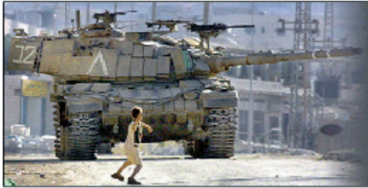
Sapan taşlarının yanında füze, Başka alemlere farkımız bizim. (Necip Fazıl)

Yüz yılı geçen bir süredir Balkan coğrafyasında sayısız katliamın, sürgünün muhatabı olan biz Müslüman Arnavutlar Filistin'in Müslüman halkını ve onların meşru direnişini selamlıyoruz.