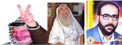
Yaser Arafat Şeyh A. Yasin Fethi Şekaki

Filistin'in mücadelesinde yer alan tüm liderleri ve adı bilinmez nice şehitleri saygıyla anıyoruz.