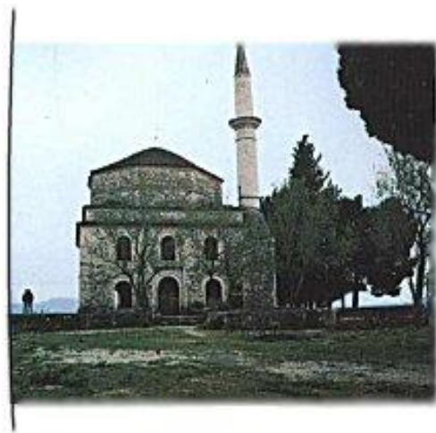
Yanya Mustafa Efendi Camii

i shpunë në vendet e paracaktuara jashtë qytetit dhe i grinin me thika e plumba. Rreth 15-20 dhjetorit 1944, gjatë disa ditësh me shi të dëndur të pandërprerë, kur dukej "sikur ish çarë qielli" dhe nëpër një të ftohtë të llahtarshëm, EOEA-sitët, duke mos patur shteg tjetër, dëbuan kë kishte mbetur ende gjallë nëpër birucat e Filatit dhe të Paramithisë; gati 360-370 vajza, gra, fëmijë e plaka i vunë me shkop përpara dhe, duke mos ua ndarë atë nga kurrizi, i lëshuan hej nëpër pllajën malore të Shëndëlliut dhe grykën shkëmbore Koskë-Vërvë. Të lënë në një vend kur bora arrinte gati në një metër trashësi, kur shiu binte "si krahu" dhe murlani ushtonte e uturinte si i marrë, duke mos e ditur vendin për të dalë këtej kufirit, 25 vetë - kryesisht fëmijë rreth 10-vjeçarë, ngrinë nga të ftohtit; ndër ta edhe e mbesa e myftiut të Paramithisë, e vetmja e mbetur ende gjallë.