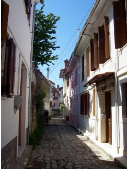
Yanya'da Türk Evleri

patur njëfarë ndërhyrjeje të vakët nga qeveria italiane e ajo austro-hungareze, gjaku do të kishte vajtur deri në gju dhe shfarosja e popullatës shqiptare islamike do të kishte qënë tërësore që asokohe.