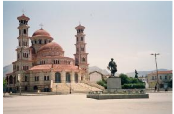
Korça Ortodoks Kilisesi

Ancak dördüncü haçlı seferin Bizans'ı almasıyla (1204) Arnavutluğa Fransız papazları getirdi ve burası bir misyonerlik merkezi oldu. Çünkü Arnavutluk hem doğunun kapısı, hem de Doğu ve Batı'nın köprüsü idi. 23 Doğu kilisesinin, Arnavutluk'a kattığı en büyük unsurlardan birisi kilise mimarisidir. Bugün de kiliselerin, antik binaların doğu tarzı gözümüze çarpar. Genelde asrılar boyu Adriyatik denizin ilk durağı olan Arnavutluk'ta batı ve doğu kültürü, siyaseti, askerisi, hayata bakışı burada buluşmuş, beraber yaşamış, çatışmıştır. Hıristiyanlığın Arnavutluğa getirdiği belki en önemli şeylerden birisi de hiç kuşkusuz sanattı. Gerek heykel gerek ikona yapımında burada yaşayan insanlar uzmanlaşmış ve bu sanatı çok iyi benimseyip günlük hayatlarında yansıtmaktadırlar. 24 Bugün de, o zamanın en büyük şehirlerin mimari yapısını incelediğimizde doğu kültürünün, Bizans'ın izlerini çok büyük rahatlıkla fark etmemiz mümkündür. 25