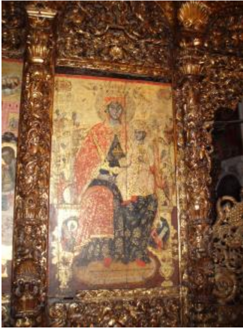
Berat Ortodoks Kilisesindeki ikonlar

Kiliselerin ayrılmasından sonra batının merkezi Roma ve doğunun merkezi Konstantinopol olacaktır. Ortodoks tarafı da kendilerince kiliseler halinde ayrılacaktır. Bunlardan Kudüs patrikhanesi (I. Asırda Yakob tarafından kuruldu), Antakya patrikhanesi (M. 68 yılında Barnabas, aziz Petrus ve aziz Pavlus tarafından kuruldu), İskenderiye patrikhanesi (M. 62 yılında Markus tarafından kuruldu) ve Fener Rum patrikhanesini (Konstantin zamanında kuruldu 285–337) görmekteyiz. Ayrıca 867–886 yılları arasında Sırp Ortodoks kilisesi de kurulacaktır.