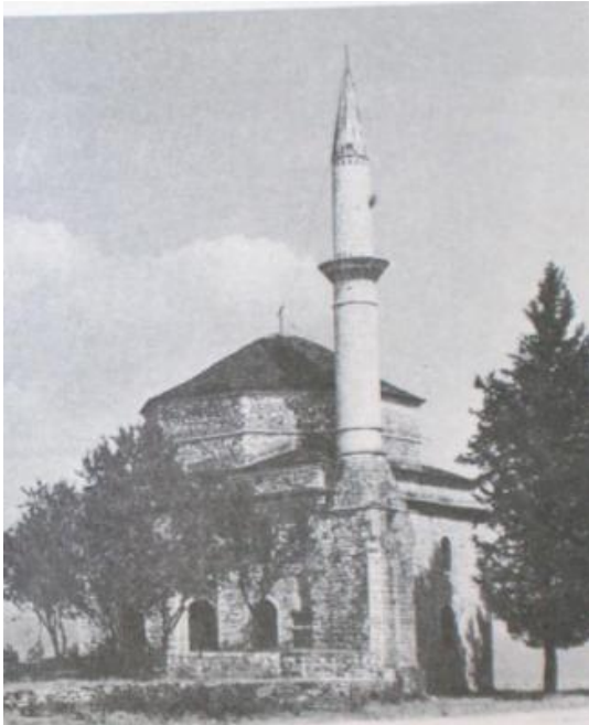
Yanya Fethiye Camii

Synimi kryesor i kryqtarëve athino-fanariotë ka qenë dhe mbetet shndërrimi në grekër i shqiptarëve të krahinave fqinje. Meqë pengesën kryesore në këtë drejtim e përbënin shqiptarët islamikë, pre e tyre u bënë pikërisht këta. Mjetet kryesore që përdorën e që po përdorin ende për tjetërsimin e përkatësisë së tyre kombëtare kanë qenë –dhe janë- kishat, manastirët e shkollat. E kur me këto mjete nuk arritën pikësynimin e vet, për t'i zhdukur prej trojeve të veta stërgjyshore dhe për t'ua grabitur ato troje, vunë në përdorim armët.