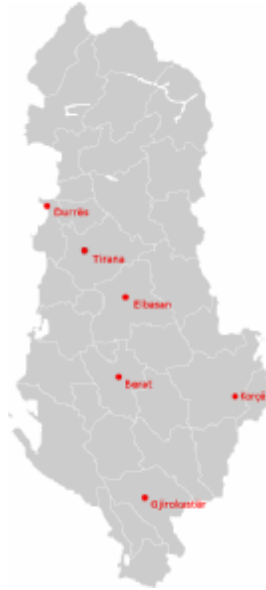
Arnavutluk'ta Ortodoks Kilisesi Merkezleri

resmi manada olmasa da ayrılmış durumdadır. 869 yılındaki İstanbul'da toplanılan konsilde Patrik Photius; "Kutsal Ruhun hem Baba'dan, hem de Oğul'dan çıktığını" kararını reddettiği için kiliseden "aforoz" edilirken kendisi yeni bir konsil toplayıp (İstanbul 879) "Kutsal Ruh'un sadece Baba'dan çıktığını" karara bağlamıştır. Bu imparatorluğun sadece siyasi manada değil, teolojik açıdan da ayrıldığını gösteriyordu. Ancak bu resmi olarak dünyaya açıklanmamıştı. 3