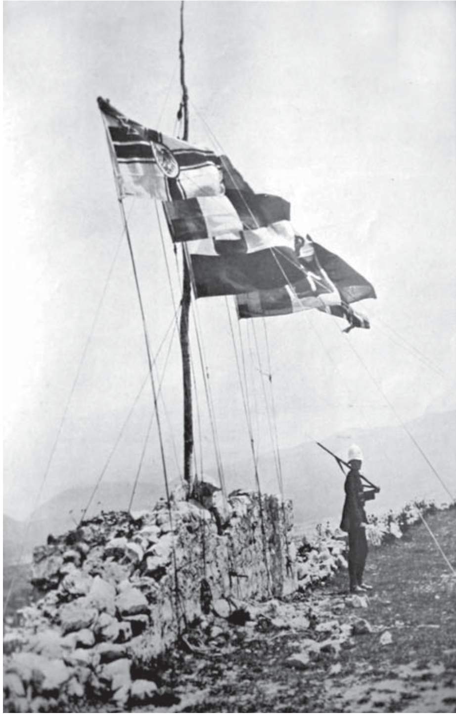
İşkodra Kalesi - 1913