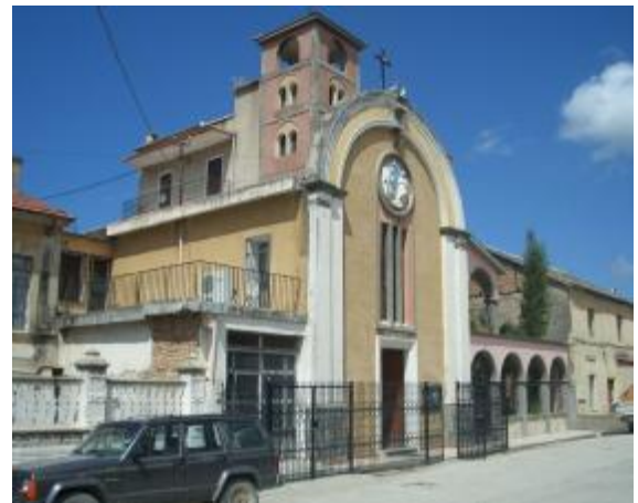
Vlora Katolik Kilisesi

- Oruç konusunda da her iki kilise de farklı bir uygulama görülmektedir 15 .