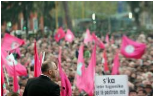
Enver Hoxha'nın talebeleri Sosyalistler İslam karşıtlığında aynı çizgiyi izlediler.

Arnavutluk Müslümanları 1997 yılında geçmişteki acılarına yeniden döndürüldüler. Yunanlılar ve CIA 1997’de Sali Berisha’nın demokratik rejim yapısına karşı yapılan darbeyi desteklediklerinde demokrasinin ana destekçileri Arnavut Müslümanlar için yeni bir zulüm dalgası başlatıldı. Eski komünist ve zimmi geçmişiyle, fundamentalist Arnavut ve Ulahların baskın olduğu Arnavutluk Sosyalist Partisi 1997 yılında iktidara geldi. Onların İslam’a karşı olan nefretleri tüm politik hareketleri ile ortaya konuluyordu ve bazı Batılı analistler Sosyalist Partiyi ve onun rejimini ‘biraz Ortodoks eğilimli’ olarak değerlendiriyorlardı. Onların yönetiminin ilk dönemi boyunca sosyalistler Arnavutluk’ta İslam’a karşı ikinci bir haçlı savaşını yürüttüler ve ülkede bir çoğu Araplar tarafından işletilen İslami organizasyonları kapattılar. Dini pratiğe sahip Müslümanlar ve imamlar , zulüm ve kötü muameleye tabi tutularak bezdirildiler.