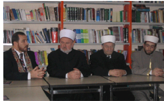
İmamlar halen en az ücret alan din adamlarıdır

MCA'nın ekonomik durumunun çok kötü olması ülkedeki otoritesinin aşırı kaybının nedenlerinden biridir. MCA'nın ülkedeki camilerinde hizmet veren imamlar, ülkedeki en düşük ücret 120 Amerikan Dolarıyken, sıklıkla aylık 40 Amerikan Doları ücret alıyorlar ve kimi zaman da hiçbir şey almıyorlardı. MCA'nın 2004 yılı boyunca aylık bütçe açığı, sadece Tiran'daki yönetimin masraf ve örtülü giderleri için 5000 Amerikan Dolarının üzerindedir. Bunun sonucu olarak MCA'nın en yüksek seviyedeki personeli aylık 220 Amerikan Doları ücret alabiliyorken, Arnavutluk Ortodoks Kilisesi'nin en düşük seviyedeki personelinin aylık maaşı 300 Euro'dur. Bu geliriyle MCA, Balkanların en pahalı ülkelerinden biri olan Arnavutluk'ta din görevlilerine en düşük ödemeyi yapan kuruluştur. Ülkedeki diğer din görevlileriyle karşılaştırıldığında Arnavutluk Müslüman Toplumu'nun personeli onların en fakirdir. Eğer onlar gerçekten bir "Müslüman Merkez" yaratmak istiyorlarsa MCA'nın yoksulluğu ve onun personelinin ihtiyaçları ümmet ve Arnavutluk Müslümanları tarafından karşılanmalıdır. Ancak Arnavutluk'un genel yoksulluğu Müslüman Ümmet'ten izolasyonu ve geri bırakılmışlığı böyle bir girişimi neredeyse imkansız kılmaktadır.