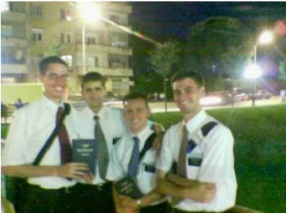
Mormon Misyonerler Tiran Caddelerinde

Arnavutluk yasalarının Müslümanlara geldiğinde dini radyoları yasaklamasına rağmen onlar dört radyoyu yönetiyorlar. Arnavutların ortak inancına göre bir çok kilisenin yönetimi ülkeye karşı casusluk faaliyetleri için istila edilmiş haldedir. Bu şüphe, yerel gazeteler bir çok misyonerin yabancı casusların faaliyetlerinde kullandıklarını açıkça itiraf ettiklerinde pek çok kez doğrulanmıştır.