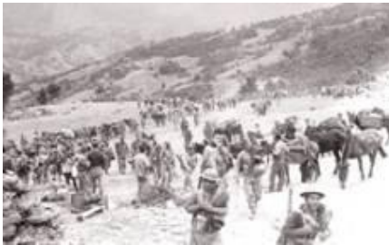
Ushtare grekër në kufirin shqiptar në vitin 1949

Shekulli i 14-të. Ja ç'shkruan Faik Konica në vitin 1940 për "bëmat" e dhespotit grek me emrin Thanas: "Në gjysmën e dytë të shekullit të katërbëdhjetë, Janinën e qeveriste një princ bizantin (ose një despot, siç e kishte titullin zyrtar) i quajtur Thanas. Këtij Thanasi i hipi në kokë ideja e bukur për të vrarë gjithë shqiptarët. Siç thotë Dukasi, (një historian grek) një nga lojrat e tyre të parapëlqyera ishte t'u priste hundët ose pjesë të tjera shqiptarëve dhe t'i linte të vdisnin në agoni".