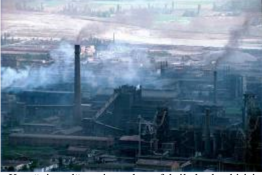
Komünizm dönemine çalışan fabrikalardan birisi

“Komünist dönemde dikildi diye neredeyse ağaçları yok edeceklerdi” Seyahatimiz boyunca bu sözün işaretlerini görüyoruz; yıkılmış binalar, sulama kanalları, fabrikalar, bomboş araziler ve dahası.