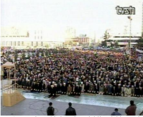
Arnavutlar şehirde onları alabilecek bir cami olmadığından Bayram Namazını Tiran'ın ana meydanında kılıyorlar

Bu gün Arnavutluk'un Müslümanları, Arnavut halkının en izole ve yoksul toplumunu temsil ediyor. Bunun aşılması için onların kendi enstitülerini, okullarını, kurumlarını ve medyalarını oluşturmaya ihtiyaçları var. Fakat onlar tüm bunlar için bir kaynağa sahip değiller. Onlar Cuma namazını kılmak için bile yeterli camiye sahip değiller. Bu gün Tiran'da, ülkenin başkentinde, sadece sekiz cami var ve Cuma günü Arnavut Müslümanlar Tiran'ın Merkez Meydanındaki eski Osmanlı camii olan Ethem Beg Camii onları içine alamadığı için zorunlu olarak dışarıda Cuma namazı kılmaktalar. Diğer camiler de aynı durumdadır.