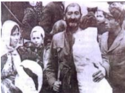
Genocidi grek ndaj çameve.

Shekulli i 14-të. Ja ç'shkruan Faik Konica në vitin 1940 për "bëmat" e dhespotit grek me emrin Thanas: "Në gjysmën e dytë të shekullit të katërbëdhjetë, Janinën e qeveriste një princ bizantin (ose një despot, siç e kishte titullin zyrtar) i quajtur Thanas. Këtij Thanasi i hipi në kokë ideja e bukur për të vrarë gjithë shqiptarët. Siç thotë Dukasi, (një historian grek) një nga lojrat e tyre të parapëlqyera ishte t'u priste hundët ose pjesë të tjera shqiptarëve dhe t'i linte të vdisnin në agoni".