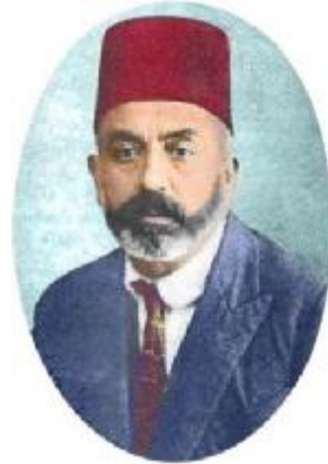
Mehmet Akif Ersoy

Hani milliyetin İslâm idi... Kavmiyet ne! 8