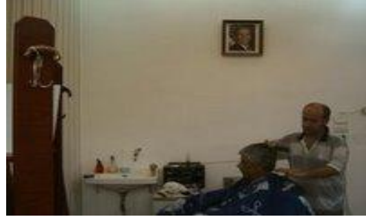
Bush portreli berber dükkanı

Pogradec'te, cami yakınlarında bir berber dükkanının içinde, duvara asılmış bir portre görüyorum. Emin olmak için dükkanın içine giriyorum. Berberin duvara asmış olduğu George W. Bush portresi beni şaşkınlık içinde bırakıyor. 20 yıl evvel Amerikan başkanlarının adını bile anamayan bu insanlar böylesine bir dönüşümü nasıl geçirdi? Ülkenin yeni cumhurbaşkanı Bamir Topi 24 Temmuz 2007'deki yemin töreninde Avrupa - Atlantik entegrasyonu için çalışma sözü verirken Arnavut halkının –en azından bir kısmının- entegrasyonu, evlerine amerikan bayrağı, işyerlerine Bush portresi asacak kadar aşmış olduğunu biliyor muydu acaba?