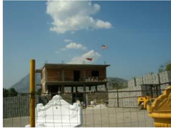
İnşaata dikilmiş bir Amerikan bayrağı

Müslümanlar hakkında Hafız Abdullah Zemblaku tarafından kaleme alınmış eserler. Bu kitapları Komünist dönemin kitap yakıcılarından saklayarak kurtarmayı başarmışlar. Mihmandarım Olsi Jazexhi kitapların bir kısmının dönemin Müslümanlarının siyasi anlayışını da yansıtmaya sebebiyle önemli olduğunu söylüyor. Kitapların fotokopilerini alabilmek için Korçe'ye dönüyoruz. Bu kitapları bulmuş olmak bizi sevindirirken, Zemblaku köyü yakınlarında inşaat halindeki bir evin çatısına çekilen Amerikan bayrağı bize bir burukluk yaşıyor. Türkiye'de olduğu gibi orada da biten inşaatların çatısına bayrak çekme adeti var. Bush'un berber dükkanındaki portresinden sonra halktan birisinin evinin çatısında bir Amerikan bayrağı.