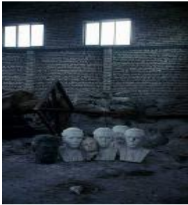
1990 sonrası Enver ve diğer faşistlerin büstleri sökülüp atılmıştır.

1985 yılında Enver Hoxha'nın ölmesiyle komünizm sistemin de sonu geliyordu. Nitekim 1990 yılında Arnavutluk komünist sisteminden sıyrılarak kendisini demokrasiye, dini özgürlüğe açmıştır. Diğer komünist ülkelere bakacak olursak, onlarda dinin yasaklanmadığını görmekteyiz. Mesela, Rusya federasyonu ülkelerinde din yasaklanmamıştır, Yugoslavya'da da aynı, ama Arnavutlukta din çok çetin bir şekilde saldırılmış, yasaklanmıştır. Bunlara binaen de aklımıza takılan onca sorulardan birisi de: Madem bu ülkeler komünist, bunlarda da din yasak değil, niye komünist Arnavutlukta din yasak olsun? Elbette bu sorunun cevapları çoktur ve dinin yasaklanması için komünistlerden gösterilebilecek sebepler çoktur ama bence iki sebep vardır ki bunlar en gerçek sebeplerdir.