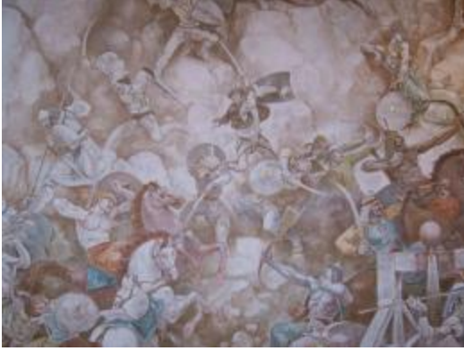
Komünist tarihçiler Osmanlı – Arnavut ilişkisini bir savaşlar zinciri olarak resmeder.

inanç olarak kabul ettiğini ortaya koymaktadır.