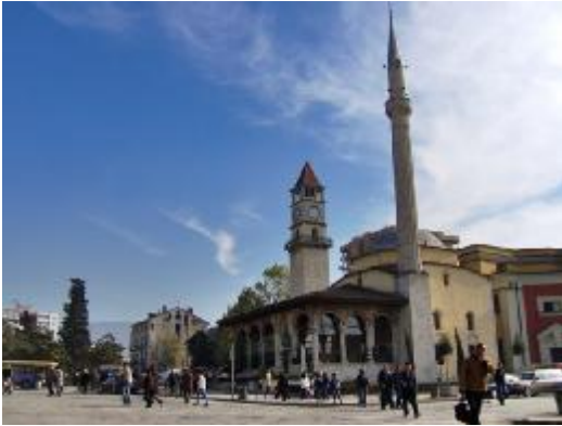
Ethem Bey Camii komünist rejimin hışmından kurtulan ender camilerden birisidir.

Arnavutluk Diyanet İşleri Başkanlığı kaynaklarına dayanarak, 1939 senesine kadar Arnavutluk'ta Osmanlı döneminde inşa edilmiş 1667 cami ve mescidin mevcut olduğunu biliyoruz. Yüzyıllara dayanan bu müesseseler, komünist rejim tarafından yerle bir edildi ya da başkalaştırıldı. Sadece bir kısmı kültürel anıt olarak kullanılmak üzere bırakıldı.