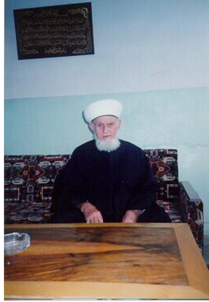
Hafız Sabri Koçi

Arnavutluk İslam Toplumu Başkanlığı'nın yapılanması Türkiye Diyaneti'nin yapısı ile yakınlık arz etmektedir. Yönetimin başında başkan ve maiyetinde merkez teşkilatı, illerde ve ilçelerde müftüler ve din görevlileri bulunmaktadır. Türkiye Diyaneti'nden farkı ise, devlet tarafından sağlanan bir bütçesinin olmayışıdır. Hizmetler iç ve dış kaynaklarla yürütülmeye çalışılmaktadır.