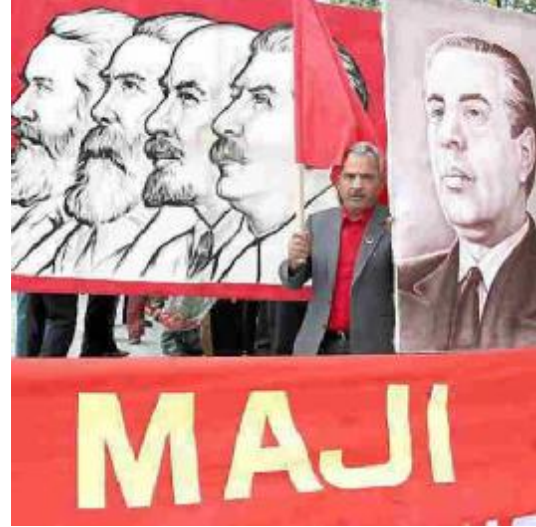
Arnavutluk 45 yıl boyunca faşizmin sol versiyonu ile yönetildi

sarsılmak bir biçimde geçerli olduğunu, devrimin zaferinin kaçınılmaz olduğunu saptayacağız." 3 Ve bu düşünceyi gerçekleştirmek için yola koyuldu. 1946 yılından 1990 yılına kadar, batılıların verdikleri adı ile tamamen "Ksenofobik" bir yönetim uygulamıştır. 4 1961 yılında Arnavutluğun siyasi faaliyetlerini kendi doğrultusunda bulan Rusya diplomatik ilişkilerini kesti.