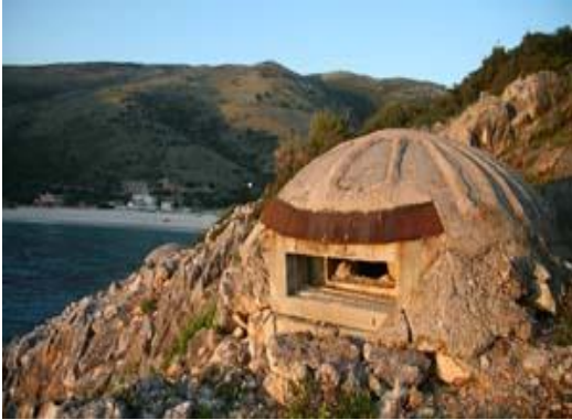
Enver'in bunkerlerinden birisi

ilişkilerinden soyutlayıp tamamen yalıtılmış bir rejim haline getirdikten sonra Amerikanın her an Arnavutluk'a saldıracağı ve ülkenin karış karış korunması gerektiği tezini işlemeye başlar. Rivayete göre Enver Hoxha'ya Arnavutluk'ta sayılarının ne kadar olduğunu kimsenin bilmediği bu bunkerlerin yapımını görev süresi Temmuz 2007 yılında biten cumhurbaşkanı Alfred Moisiu salık verir. Tek kişilikten başlayarak, büyük topların sığabileceği kapasiteye kadar uzanan sayısız bunker Arnavutluk topraklarının hemen her yerini kaplamış halde. Yapımına yaklaşık 5 milyar dolar harcanan bu bunkerlerin imhası da kolay değil. Bu sebeple öylece duruyorlar. Anlatılan o ki, Enver Hoxha bu kadar beton ve demir ile ülkenin tüm yollarını yapabilirmiş. Peki, diyorum; bunca modern silaha karşı ne yapabilir ki bu iptidai sığınaklar. Hayır, diyorlar. Bunların yapımı ve denemesi sırasında Enver mühendisleri içine sokuyor ve öyle deniyordu. Yine 1999'da Sırp ordusunun Kukës tarafından Arnavutluk'a girdiğini ve bunkerlerin içindeki UÇK askerlerini top atışına tuttuğunu, bunkerlerin işe yaradığını söylüyorlar. Bunkerleri söküp Lübnan İsrail sınırına, Müslümanların cephesine göndermek gerektiğini söyleyenler bile var. Ayrıca, yerel hediyelik eşya dükkanlarının değişmez malzemelerinden biri de bunker modelinde yapılmış hediyelikler.