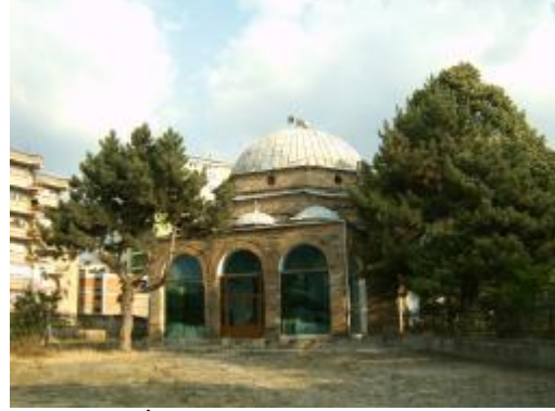
İlyas Bey Mirahori Camii

tarihi bir heybeti omuzlamış görünüyordu. Konuştuğumuz insanlar bugün itibariyle Korçe'de yapılan 12 kiliseye karşılık sadece 2 caminin olduğunu söylüyorlar.