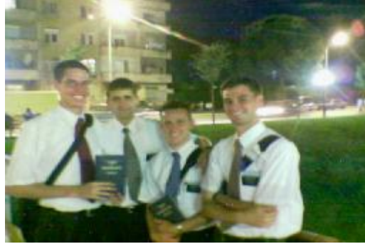
Tiran sokaklarında Mormonlar

Arnavutluk’ta 9 tane kiliseleri vardır. Matbaaları olmadığı için broşür ve malzemeleri Almanya’dan alırlar, basıp Arnavutluk’a getirirler. Misyonerler ikişer yıl faaliyet yapmaktadırlar. Konuştuğum ikisiyle Arnavutçayı, Arnavut kültürünü, Arnavutların karakterini, Arnavutluk’un sorun ve problemlerini çok iyi biliyorlar ve arkaların hem siyasi manada hem de maddi manada çok güçlü olduğunu anlattılar.