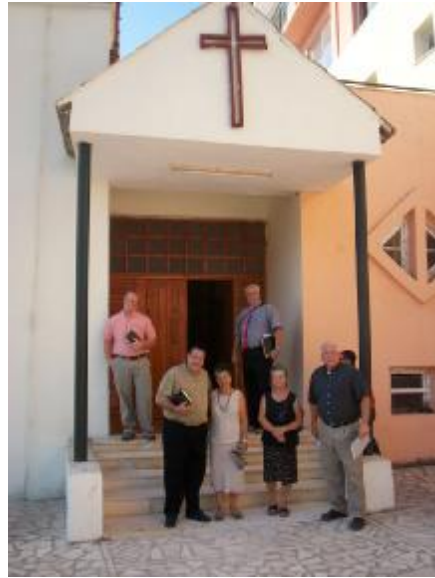
Saranda Baptist Kilisesi