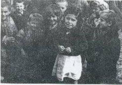
Përrijë çamë të mbetur jetimë, pasi prindërit e tyre n- oranë dhe n- masakra n- nga bandat e N. Zervës

On dokuzuncu yüzyıl İngiliz seyyahlarından Lord Byron ve arkadaşı John Hobhouse, bu bölgelerde Arnavutça konuşan insanların yaygın olduğunu belirtmişlerdir. Arnavutlukta Yunan azınlığın durumu hakkında pek çok değerlendirme yapılmış olmakla birlikte, Arnavut devletinin kurulmasından sonra Yunanistan'da kalan Arnavut azınlık hakkında çok az bilgi vardır. Bu Arnavutların çoğu aslında Hıristiyan Ortodoks olup, Osmanlıdan sonraki yıllarda İslam'a geçmişlerdir. Arnavutların aktüel konularda görüş alış veriş yaptıkları Boston merkezli bir web sitesine göre "Yunanistan'daki Arnavutlar iki ayrı kategoriye ayrılmaktadır: Arnavut topraklarında yaşayan; ancak Büyükelçiler Konferansı (Londra, 1913) sırasında adaletsiz bir şekilde belirlenen sınırların dışında kalmış Arnavutlar ve 14. ve 15. yüzyıllardaki ilk diaspora sırasında Arnavut topraklarından ayrılmış Arnavutlar". Bu Arnavutlar, Osmanlı İmparatorluğu'na karşı yapılan savaşlar sırasında anavatanlarına kaçmışlar ve çoğu Euboea adasına yerleşmiş; diğerleri ise İtalya'ya gitmiştir.