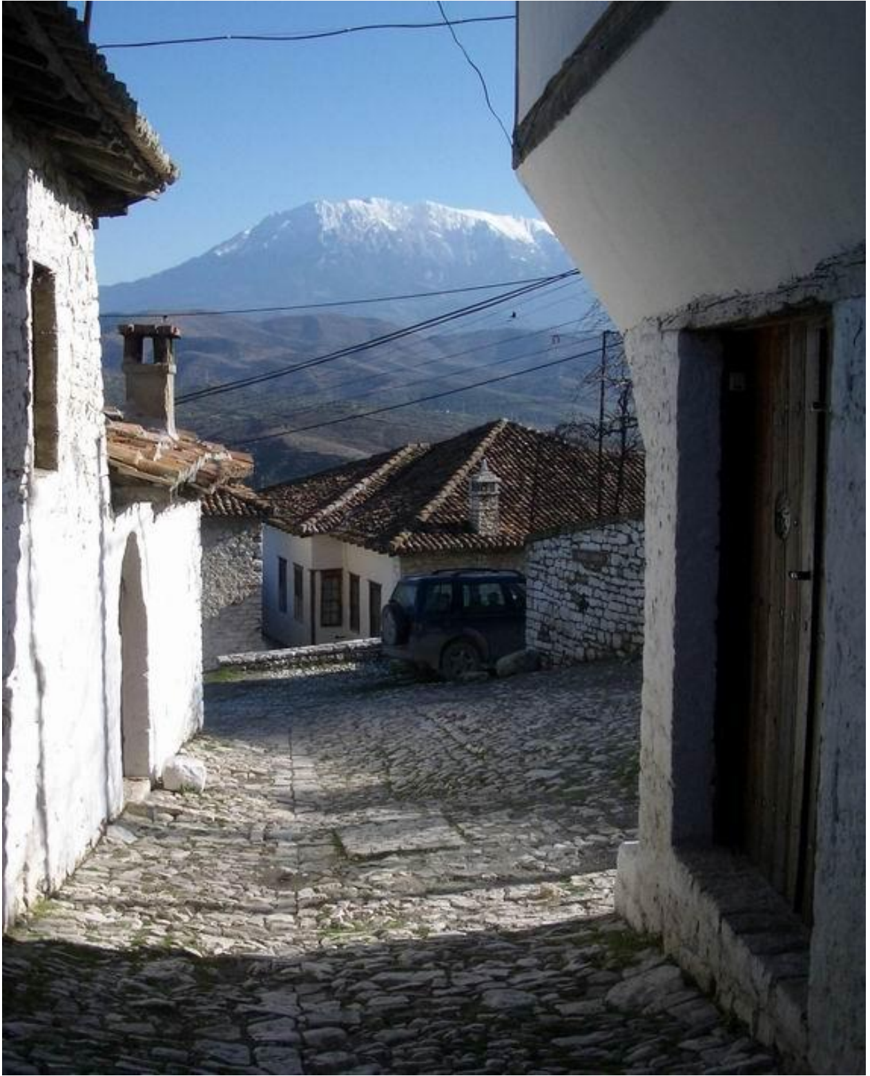
Berat'tan bir kare