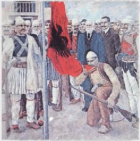
PORTRET: SHPALLJA E PAVARËSISË - VLORË 1912 ISA BOLETINI puth flamurin

Arnavutların büyük çoğunluğu Müslüman olduğu halde İslamofobi ve Türkfobi Arnavut devletinin kurulduğu 1912’den beri Arnavut kültürünün bir parçası oldu. Çünkü Balkanlardaki İslam Türklerle ilişkilendiriliyordu ve onların kovulmasıyla Arnavut milliyetçileri, (öncelikle Hıristiyan ve Bektaşî geçmiş sahipler) imparatorluğun düşmesinden sonra iktidara getiriliyordu, Türklere karşı nefret ile doldurulmuş bir milli hikaye inşa ettiler ve doğrudan veya dolaylı olarak Arnavutluk’un Sünni Müslümanlarını onların işbirlikçileri olarak resmettiler.