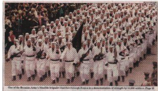
1995 – Zenica

Bununla beraber, küreselleşmenin yerel olanla global olanın ilişkisini eş zamanlı olarak kuvvetlendirdiği ve arttırdığı biliniyor. Yerel direncin, daha küresel olan İslami fikirlere son tavrı ne olacak göreceğiz. ( Birçok kez yerel İslami geleneğin savunucuları, Bosna camilerinde Selefilere karşı şiddet uygulamış veya camilere girmelerini engellemiştir). Şu an itibariyle görünüyor ki yerel İslami uygulama, daha evrensel olan İslami uygulama ve fikirlerle bağdaşmak için bazı açılardan etkilenip değişse de genel bazda galip gelen taraf oldu. Sonuç olarak, İslam toplumu (IC) ve bazılarının milli İslam dediği geleneksel uygulama, bugün on beş yıl önce olduğundan daha güçlüdür ve yakın gelecekte bu pozisyonu kaybedeceğine inanmak için de bir sebep yok.