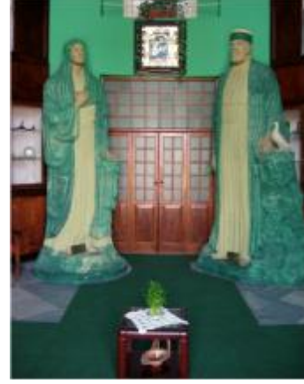
Temsili Bektaşî dervişleri