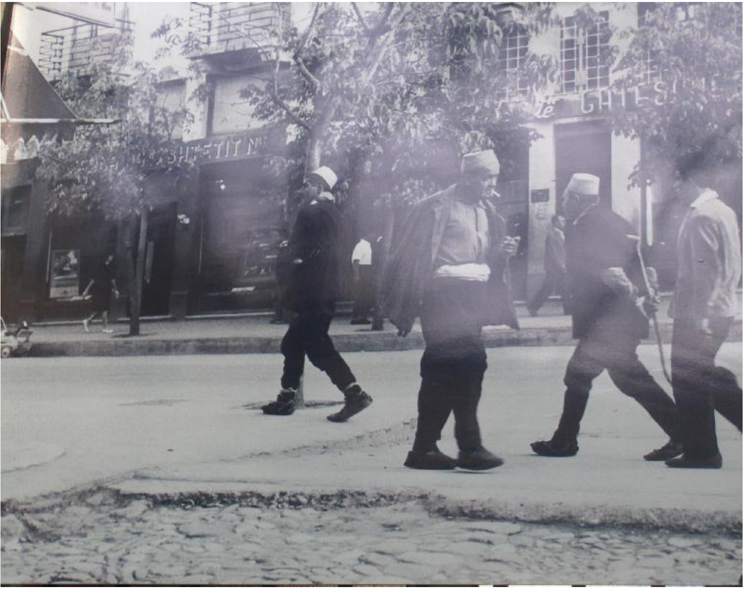
Tiran, Ekim 1963 (Taksim, İstiklal Caddesindeki bir sergiden alınmıştır.)