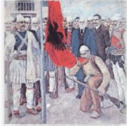
PORTRET: SHPALLJA E PAVARËSISË - V LORE 1912 ISA BOLETINI puth flamurit

Osmanlı İmparatorluğunun son günlerinde Osmanlılık karşıtlığının merkezleri olduğu gerçeği Arnavut ulusalcılar tarafından Bektaşîlikle ilintili modern ulusalcılık miti yaratmada kullanıldı. Bektaşîler tarafından kullanılan "Biz ne Türk'üz ne de Gavur, biz Arnavut'uz" sloganı yeni Arnavut devletinin ihtiyacı olan şeydi.