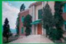
Selia e Kryegjyshitës Botërore Bektashiane

Klerikët Bektashianë kanë qënë gjithmonë në shërbim të çështjes kombëtare, kundër çdo okupacioni.