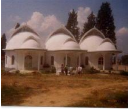
Tiran'da Bektaşî türbesi