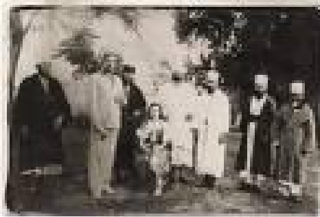
Kral Zogu Bektaşilerle

Bektaşiler sultan Mahmud II'nin etkilerinin kendilerini Arnavutluk'ta bile takip ettiğini iddia ederler. En büyük tekkelerinin birinin sonucu olarak, Berat'taki Baba Aliko'nun tekkesi sultanın takipçileri tarafından yakıldı. 22 Hakikat ne olursa olsun, Bektaşiler Tazminat reformları Çağı boyunca Osmanlı Balkanlarında büyük bir özgürlük buldular ve gelişme gösterdiler. Birge, 19. yüzyılın ortalarında Osmanlı elitleri arasında çok etkin olduklarına ve bazılarının sultan Abdulaziz'in annesinin bile Bektaşi olduğunu iddia ettiğine dikkat çekmektedir. 23