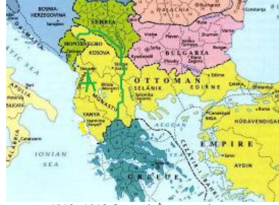
1910 -1912 Osmanlı İmparatorluğu

tehcir edilmişler; Sırp, Yunanlılar, Makedonlar, Karadağlılar, Bulgarlar ve Hırvatlar tarafından anlatılamayacak derecede ağır, sürekli ve yoğun bir şekilde zulüm ve işkencelere maruz bırakılarak katledilmişlerdir.