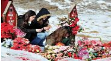
Bağımsızlığın faturası ağır olmuş.

Bölgeye önce tarihi bir kent olan Prizren'den giriyorum. Yol boyunca Sırp'lar tarafından katledilmiş Arnavutların mezarları ve acımız hala taze dercesine bu mezarlardaki rengarenk çiçekleri görüyorum. Bağımsızlığın bedelinin çok ağır olduğu, Müslüman Arnavutların bağımsızlık yolunda ağır bir fatura ödedikleri yol kenarlarındaki bu mezarlardan açıkça anlaşılıyor.