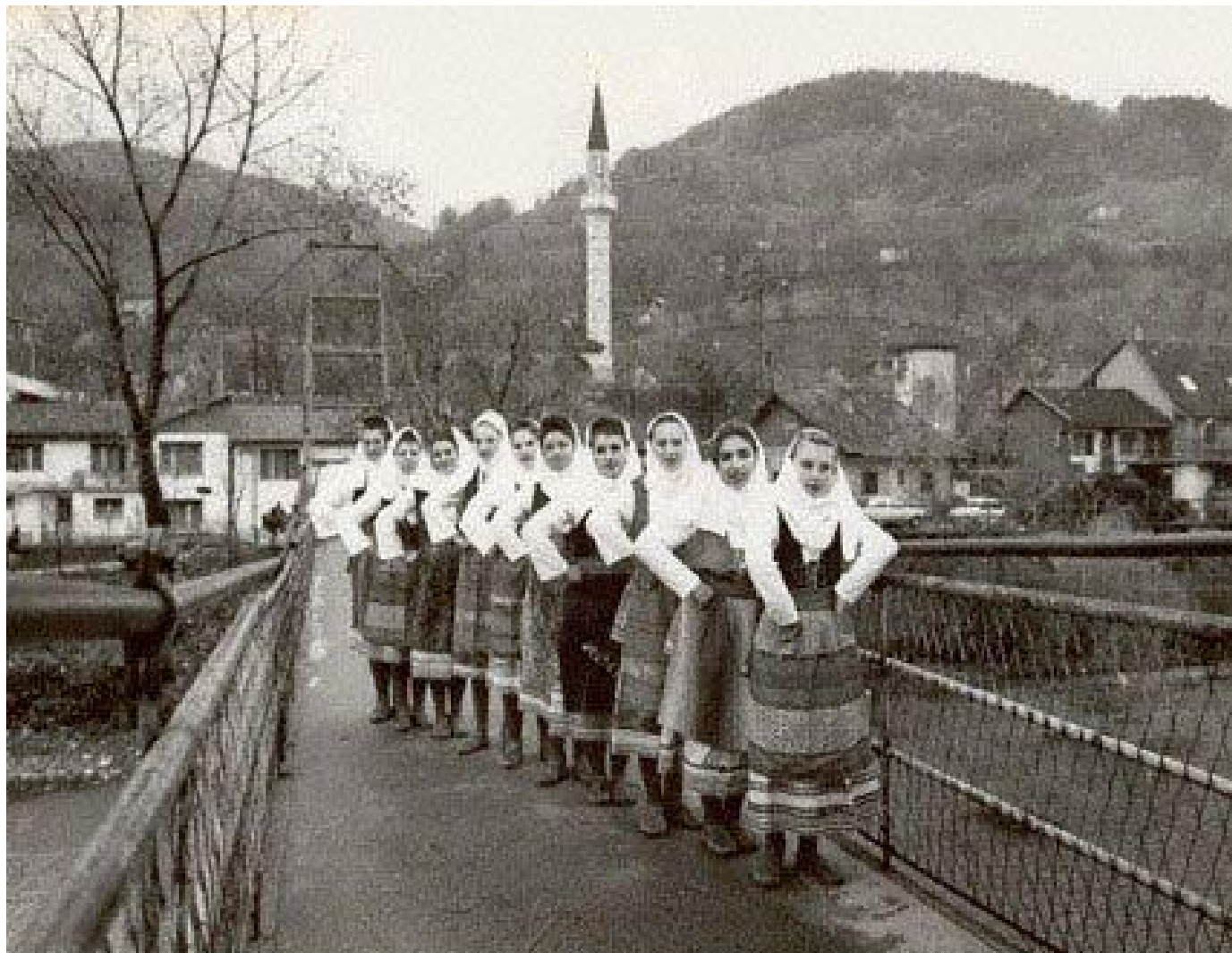
KUD "Budućnost"- Gornji Šeher, Banja Luka 1985. godina