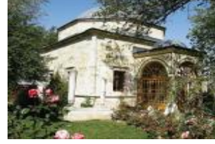
Sultan Murat'ın Türbesi

Kosova'ya yerleştiklerini, o tarihten bu yana türbeye hizmet ettiklerini söylüyor.