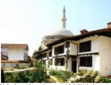
1878'de kurulan Arnavut birliğinin merkezi

Arnavutlar burada toplanıyormuş. İçerdeki medreseyi ve otantik eşyalar sergisini ziyaret ediyoruz.