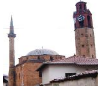
Priştine Osmanlı eserleri ile dolu.

Priştine bir kültür ve üniversite merkezi. Ülkenin kuzey doğusunda yayla üzerine kurulu, kıtalararası yolların kesişme noktasındaki şehir, sırtını doğusundaki Girmia Dağı eteklerine dayamış ve güneybatıya dönük yüzüyle engin Kosova Ovası'nı seyretmekte.