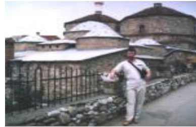
Gazi Mehmet Paşa hamamı

yıkılmış, bunların ancak bir kısmı onarılabılmış. Bistrica nehri kıyısında kurulmuş kenti ikiye bölen nehir üzerindeki köprüler ve Balkanların en uzun minareli camisi olan Sinan Paşa Camisinin heybeti kentin Osmanlı kimliğini ilk bakışta ortaya koyuyor. Cami etrafındaki meydana şadırvan deniliyor. İslam'ın hakim renk olduğu kentte sadece 30'ar metre aralıklarla Sinan Paşa Camisi, Sırp Ortodoks Kilisesi ve Katolik Kilisesi'nin varlığını görmek Müslümanların derin bir anlayışa sahip, çatışmadan ve nefretten uzak insanlar olduğunu ortaya koyuyor. Ziyaret edilmeyi hak eden onlarca tarihi eser arasında ilk akla gelenler restore edilen Osmanlı Mezarlığı ve Gazi Mehmet Paşa Hamamı oluyor. Ancak dediğimiz gibi, tarihi dokunun böylesine yoğun olduğu bir şehirde tüm eserleri gezip görmek bir günde bitirilebilecek bir iş değil. Bu şehre gelenlere buradaki kalış sürelerini asgari 2 – 3 gün olacak şekilde ayarlamalarını ve kendilerini şehrin gizemine bırakmalarını tavsiye ederim.