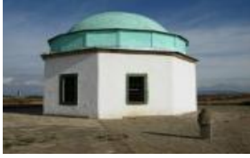
Gazi Mestan'ın türbesi

Hristiyan nüfus bir kiliseyi bile ancak doldururken barış gücünün desteği ile şehrin merkezine bir katedral inşasına başlanmış. Fakat henüz inşaat halindeyken içinde birisi öldüğü için açılmamış. Sebebi de bunun büyük bir uğursuzluk telaki edilmesiymiş. Müslüman nüfusun olanca çokluğuna rağmen caddelerden birine Rahibe Terasa'nın ismi verilmiş. Arnavutluk'ta Osmanlıya karşı ayaklanan İskender Bey'in bir heykeli de buraya dikilmiş. Halbuki İskender Bey'in Kosovalı Sırplar ile mücadelesine tarih şahitlik etmiş değil. Bir takım güçler bir yandan Osmanlı düşmanlığı pompalarken diğer yandan bölge halkının Hıristiyanlık temelinde bir kimlik ile yeniden inşası için çaba sarf ediyor.