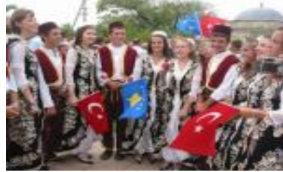
Türkiye'ye karşı büyük bir sevgi var

Kosova'nın sanayisi yok ve Türkiye'den gelen mallar pazara hakim durumda. Türkiye'nin ekonomik ağırlığı, bölgede izlenen Türk televizyonları bize Türkiye'nin güçlü etkisini hissettiriyor; ayrılışta da beraberiz misali.