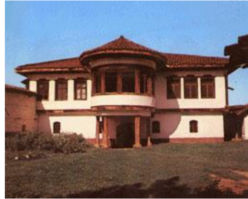
Gjakova’da tarihi bir ev