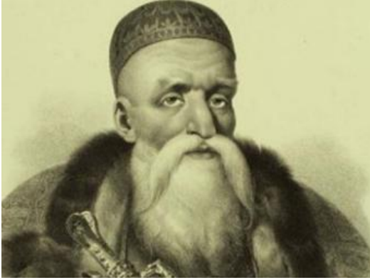
Tepedelenli Ali Paşa

Ali Paşa da bunlardan biriydi. Paşa, bütün Arnavutluğa hakim olmak düşüncesiyle hareket ettiğinden, bölgenin en güçlü paşası İbrahim Paşa ile ters düşmekteydi. Bölgede XIX. yüzyıl başlarında Yanya, Avlonya, ve İşkodra'da da güçlü paşalar vardı. Aralarında, hakimiyeti elde etmek için kavga eksik olmuyordu. Özellikle Yanya Paşası Tepedelenli Ali Paşa'nın nüfuzunu artırmak hırsı nedeniyle problem eksik olmuyordu. Ali Paşa, bu hırsı yüzünden 1800'lü yıllarda Avlonya Mutasarrıfı ile mücadeleye başlamıştı. Sözü edilen mutasarrıf İbrahim Paşa idi.