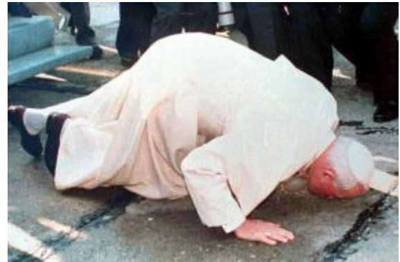
Papa II. John Paul Arnavutluk'a ilk ziyaretinde toprağı öperken

Eski devletlerde olduğu gibi yeni uluslarda geçmişlerine ihtiyaç duyar. Arnavutluk bağımsızlığı ilan edilir edilmez, aydınlar bu anıları kullanma ihtiyacı hissetti. Arnavutluk ulusal anılarında aydınların rolü bir önceki bölümde ayrı ayrı ele alındı ama bu anıların çoğu için temel dilin ve basılı eser teknolojisinin gelişimine bağlıydı. Bu iki ana değişimden önce, anılar şarkılar, türküler ve hikâyeler yoluyla saklanıyordu. Bu tez Arnavutluk ulusunun inşasıyla daha iyi anlaşılabilir. Scanderbeg'in anıları Kosova ya da güney İtalya'daki diasporanın ihtiyaçlarına hizmet etmesine göre önemli ölçüde değişir. Diaspora bir yapı olarak akışkandır ve Scanderbeg Efsanesi Arnavutluk'ta yaşayanlar için imkânsız olacak şekilde zihinsel kavrayış olarak değişimlere müsaade eder. Diasporanın zaman zaman Scanderbeg'in anılarının Arnavutluk toplumuna aktarılmasını kontrol etmesi çok açıktır.