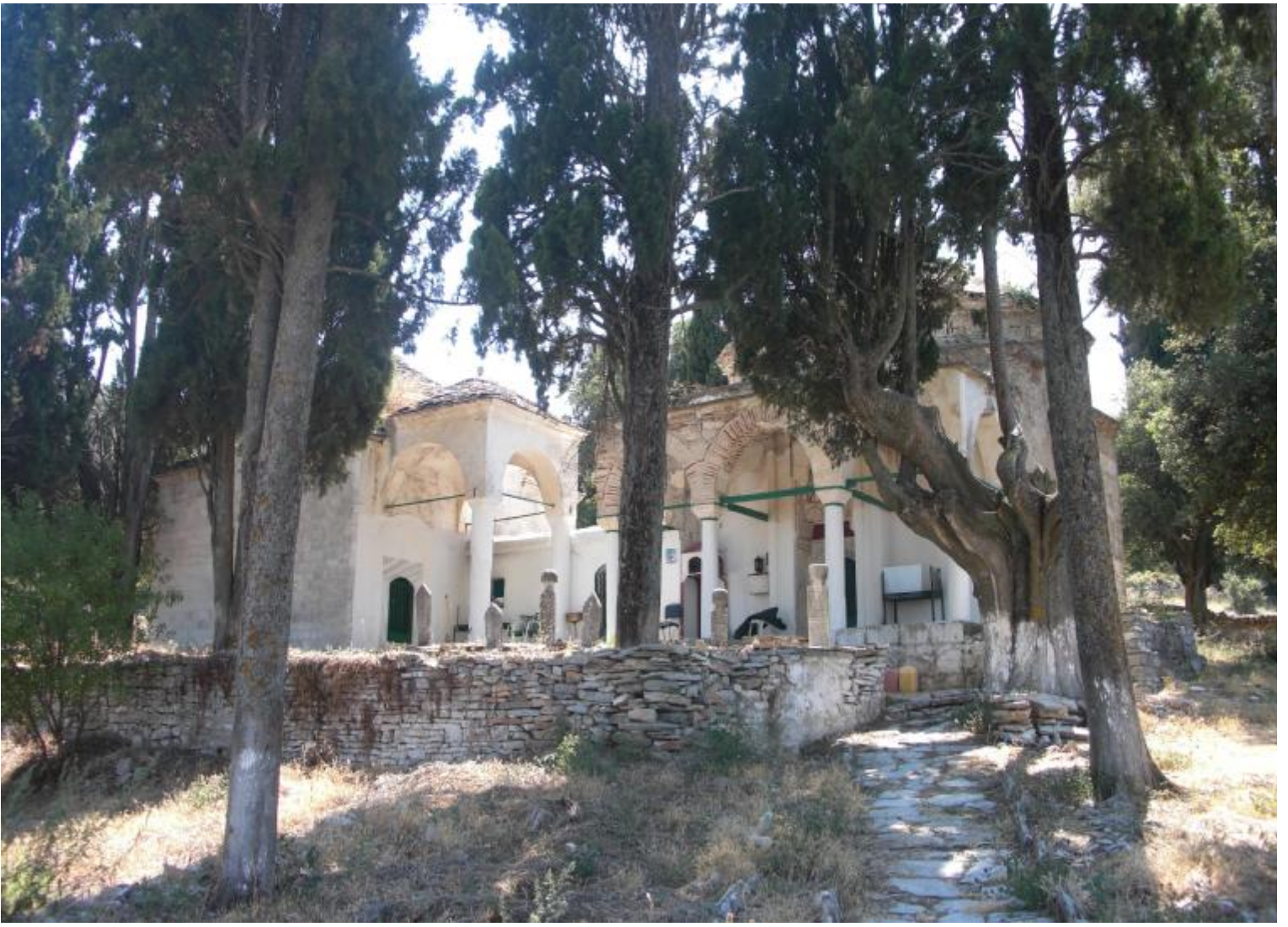
Farsalon (Çatalca), Yunanistan'da bir Bektaşî Tekkesi