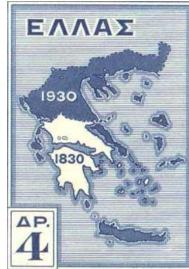
1830 – 1930 arası Yunanistan

Belçikalılar, Fransa' da ihtilal çıktıktan bir ay sonra Viyana Kongresi'nin birleştirdiği Hollandalılara karşı ayaklanmışlar, bağımsızlıklarını ilan etmişlerdi. Avusturya, Rusya, Prusya bu ayaklanmaya karşı çıkarken İngiltere ve Fransa ise sempati ile karşılamışlardı. 1830 Londra Konferansı ile Belçika'nın bağımsızlığının benimsenmesi, sınırlarının belirlenerek meşruti bir krallık kurulması, milliyetçilik ve liberalizmin başarısı olmuştu. Öte yandan Viyana Kongresi 'nde parçalanmış olan İtalya'da da ayaklanmalar baş göstermişti. Halk hem anayasa hem de yabancı egemenliğinden kurtulmak istiyordu. Ancak Avusturya'nın müdahalesi ile sonuç alamadılar. 1830 Fransız İhtilali, Almanya, Polonya, İspanya ve İngiltere' de de etkilerini hissettirmişti.