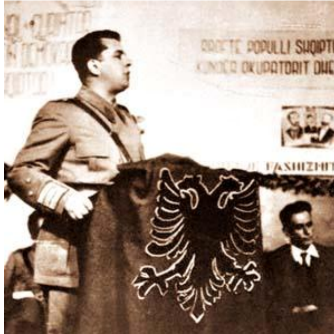
Enver Hoxha Arnavut kavmiyetçiliğini Türk düşmanlığı üzerinde yükseltmeye gayret ediyordu

Komünist Arnavutluk'un medya ve sanatında Müslüman ve Türk yetkililer çoğunlukla anadollakë (Anadolular) , prapanikë (çağdışılar) , tradhëtarë (dönekler) , dallkaukë (dalkavuklar) , turqeli (küçük Türkler) , dylberë (homoseksüeller) , aziatikë (Asyalılar) , fanatikë (fanatikler) , bixhozçinj (kumarbazlar) , përdhunues (ırz düşmanları) ve barbarë (barbarlar) olarak damgalandı. Onlar . ana görevleri İslamlaştırma yoluyla Arnavutluk'u Avrupa'dan koparıp feodal Asya'nın bir parçası yapmak olan kötülük yüklü bir misyona sahip insanlar olarak tanımlanıyorlardı. Enis Sulstarova'nın gösterdiği gibi, İsmail Kadare, komünist ve şimdiki dönemde Arnavutluk'un milli edebiyatının ana başlıca yaratıcısıdır, İslamofobinin ve Oryantalizmin en önemli yayıcısıdır. 8