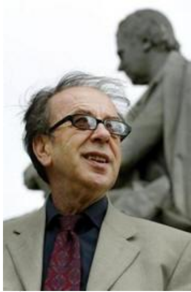
İsmail Kadare: Enver Hoxha'nın gölgesinde bir Türk karşıtı

İslamofobi ki, Kadare Türkler hakkındaki değerlendirmelerinde gösterir, sürekli olarak onların dini ile ilişkilendirilir: İslam. Örnek olarak, onun Ura me Tri Harqe romanında o, Osmanlı'nın Arnavutluk'a gelişini "...ufukta karanlık şeyler var: Türk devleti." şeklinde tasvir eder. Türk devleti feodal ve salt kötülük olarak resmediliyor ve İslam ile ilişkilendiriliyordu. Kadare "Onun minarelerinin gölgeleri bize ulaşır" diye bahseder. 14 Kadare Türkleri Avrupa'nın üzerine karanlık bir gölge getiren insanlar olarak resmeder. 15 Onun için başlıca amaç, ki Türkler Avrupa ve Arnavutluk'a (Avrupa'nın sınır bekçisi olarak betimler) karşı sahipti, Arnavutları yok etmek, onları Asyalı yapmak ve eğer onlar direnirlerse onların yerine Arapları yerleştirmek, öyle ki, Avrupa'nı edepli koruyucularının arkası kesilecekti. 16