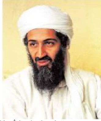
Katolikler İslam'ın kötülüğünü göstermek için Bin Ladin'e kadar uzanan bir alanı kullanır.

alana yayılır. Katolikler Arnavutluk Müslümanlarını sıklıkla gerçek Müslümanlar olmamakla yaftalar ve onların Türkler tarafından zorla İslam'a sokulmakla itham ederler ve dolayısıyla Hıristiyanlığın Arnavutların gerçek kültürel kimliği olduğunu iddia ederler. 45