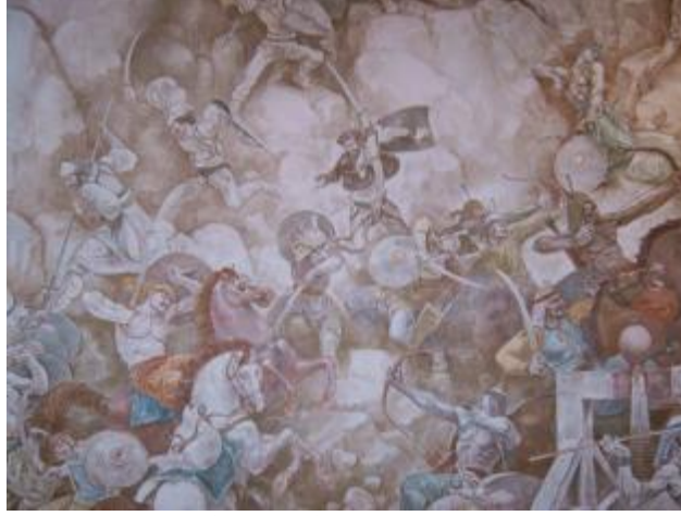
Komünistler Türk - Arnavut savaşlarını Avrupa'nın müdafaası çabası olarak resmederler.

Yakın yıllarda Arnavutların İslami kimliğine en çok saldıran Sosyalist Parti'li politikacı, 1997'den 2005 yılına kadar Arnavutluk'ta görevde bulunan ve halen ayrılmış olan başbakanı Fatos Nano idi. Onun partisi 1997'de Berisha'dan iktidarı aldığı anda o, hükümetinin tarihin 555 yıllık etkisini –açıkça Osmanlı dönemini ve onun şimdiki destekçilerini gösteriyor- tersine çevireceğini ilan etti. Bir yıl sonra o ilan etti ki, onun hükümeti, acımasızca, “politik, adi ve İslami suçları” ezecekti. Böylece o açıkça İslam'ı suç ile eşitledi. 21 2003 yılında, Elbasan Müslümanları namazgah 22 mülklerinin Nano hükümeti tarafından alınışını protesto ettiklerinde, o, eğer ‘yeni namazgah veya politik fereceler için ki, biz geçmişte bıraktık, Kostandin Kristoforidhi veya Hacı Kamil için oylama olsa ilkini seç diyerek Elbasan halkına tahrikkar bir şekilde kafa tuttu. 23 Bu metinden de anlaşılacağı gibi Nano, modernliği hicap düşmanlığı olarak resmeder ve Kostandin Kristoforidhi gibi Hıristiyan milliyetçileri öne çıkarırken, fereceyi (Müslüman kadınların iffetli giysisi) ve Osmanlı'yı seven savaşçı Hacı Kamil'in mekanını geçmişe ait olarak görür.