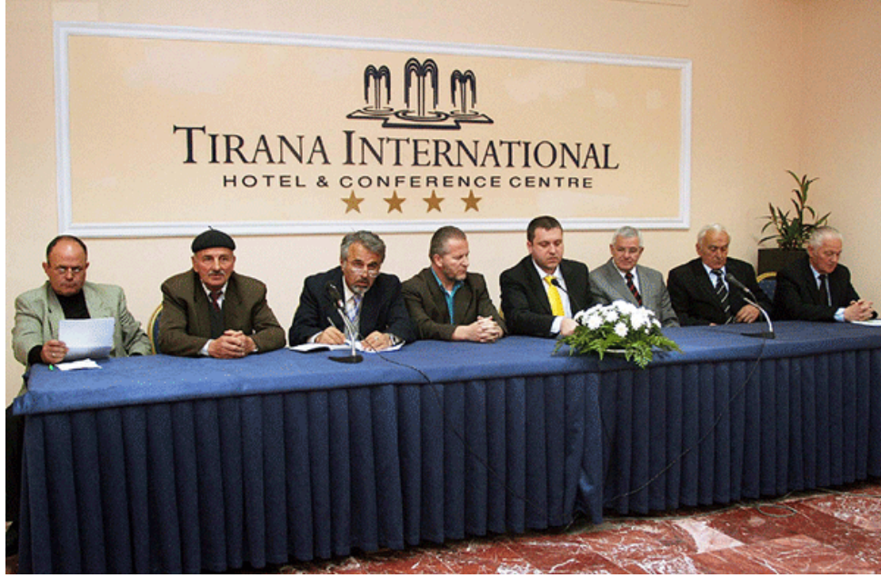
Arnavutluk Müslüman Forum'un bir basın açıklaması.

Arnavutluk Müslüman Forumu, Kültürel Anıtlar Enstitüsü tarafından Amerikan Devleti Elçiliğinden sağlanan bir fonla Fatih Camii'nin kiliseye çevrilmesi yönündeki teşebbüslere dair endişelerini Tiran'daki Amerikan elçiliğine de yükseltti. 54 Ve yakın zamanda o, şimdiki Demokratik hükümetin, kimlik kartları ve kilisenin ayrılığının korunması ve yine Arnavut milli kimliğinin Hıristiyanlaştırılması teşebbüsleri ile yüzleşilen işlerine karşı da endişelerini dile getirdi. 55